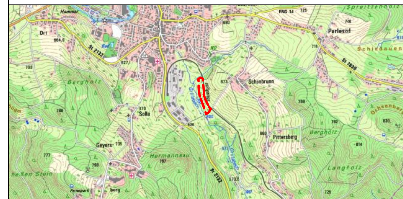
Übersichtsplan 1 : 25.000

Planunterlagen: Grundkarte erstellt von Ingenieurbüro Geoplan, Osterhofen, auf digitaler Flurkarte der Bayerischen Vermessungsverwaltung. Untergrund: Aussagen über Rückschlüsse auf die Untergrundverhältnisse und die Bodenbeschaffenheit können weder aus den amtlichen Karten, aus der Grundkarte noch aus Zeichnungen und Text abgeleitet werden. Nachrichtliche Übernahmen: Für nachrichtlich übernommene Planungen und Gegebenheiten kann keine Gewähr übernommen werden. Urheberrecht: Für die Planung behalten wir uns alle Rechte vor. Ohne unsere Zustimmung darf die Planung nicht geändert werden.